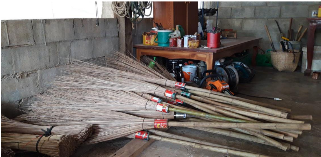
นายชิต ปานทอง ภูมิปัญญาท้องถิ่นด้านหัตถกรรม จักรสาน