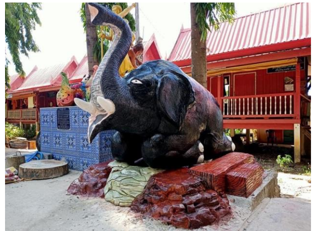
นายสงคราม ชันตี ภูมิปัญญาท้องถิ่นด้านหัตถกรรม ศิลปะวาดรูป